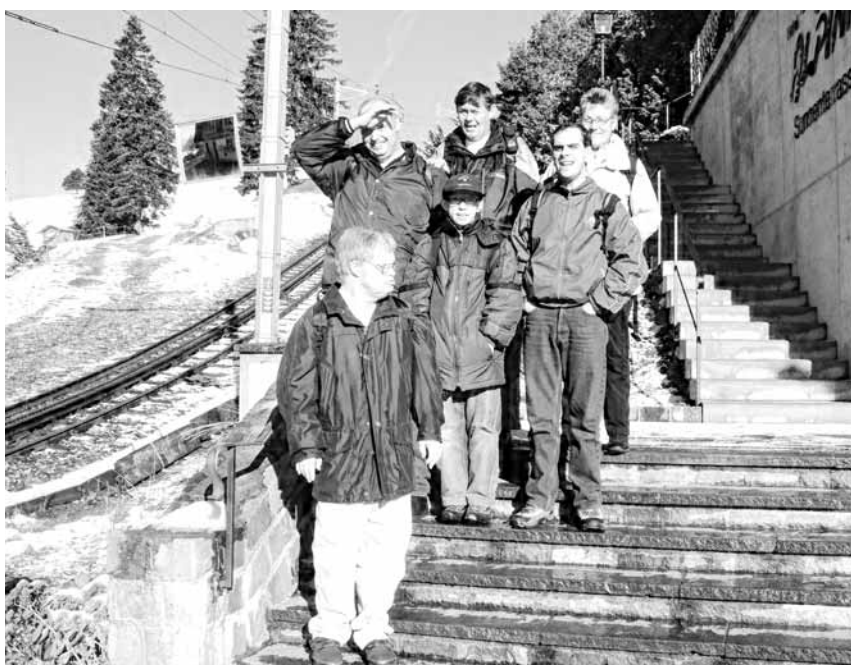
Auf dem Insieme-Ausflug konnte bereits der erste Schnee dieses Jahres erlebt werden.

Nun hiess es, Abschied von der Rigi Abschied zu nehmen. In Vitznau angekommen, bestieg die Gruppe den Raddampfer Uri und fuhr gemütlich nach Brunnen. Zu Fuss erreichte sie am Mittag das Restaurant «Pluspunkt», wo ein köstliches Mittagessen eingenommen wurde. Zufrieden und mit vielen neuen Eindrücken kehrte die Gruppe am späteren Nachmittag nach Hause zurück. (eing)